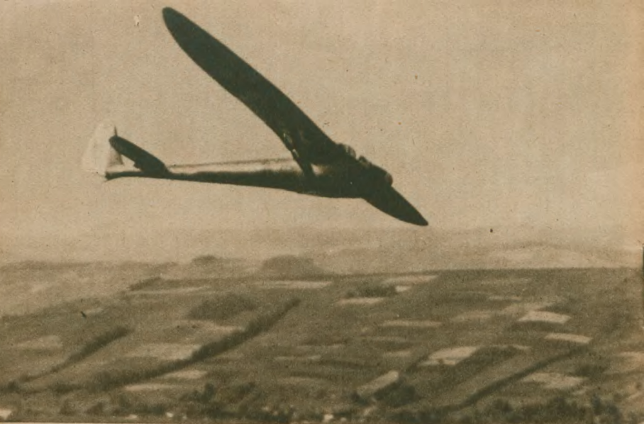
Szybowiec „C. W. S.” w locie